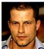
Til Schweiger Schauspieler, ebenfalls Feuertyp (19. 12. 1963), bräuchte ein Bad mit hohen Fenstern und einer Wanne im Zentrum