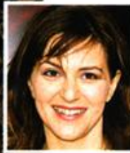
Martina Gedeck Schauspielerin, Jungfrau (14. 9. 1961): Erdzeichen-Menschen wie sie blühen auf, wenn Haus und Bad klar, durchdacht und blitzblank aussehen

zu formen, weckt Verbundenheit und tiefe Dankbarkeit. Viele Erdtypen schätzen Farben wie Moosgrün und Ackerbraun. Ihre Himmelsrichtung ist Westen, ihre Jahreszeit der Herbst. Auf langen Spaziergängen durch Wälder, Wiesen und Felder erholen sie sich am besten. Gerne umgeben sie sich mit kühlen Materialien wie Ton, Metall, Sand und Stein. Stiere, Jungfrauen und Steinböcke halten die Küche als Hort sinnlicher Genüsse für den wichtigsten Raum im Haus, danach kommt auf der Bedeutungsskala gleich das Badezimmer. Dort sollte alles in Reih und Glied stehen, so dass es sich rasch nutzen und putzen lässt. Das Bad muss nicht groß ausfallen. Aber Komfort, kluge Details oder eine sinnvolle Technikspielerei sind unabdingbar – etwa eine der Körpergröße angepasste Montagehöhe von Waschbecken und WC oder eine Kaffeemaschine mit Zeitschaltuhr neben dem Zahnpfutzbecher. Und herzlich eingerichtet möchte der Erdtyp sein Bad sehen, mit persönlichen Lebenssouvenirs, Jahreszeiten-Deko und Blühpflanzen, die eine Verbindung schaffen zur Erde draußen.