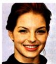
Yvonne Catterfeld Sängerin & Schauspielerin, Sternzeichen Schütze (2. 12. 1979) würde sich wohlfühlen in einem Luxus-Bad

zehen“ sie mitunter. Die typischen Farben der Feuerzeichen-Geborenen sind dynamisch und kräftig wie Kardinalsrot, Orange und Lachsteine. Als Himmelsrichtung ist Feuertypen der Süden zugeordnet, wo sie die Sonne genießen oder Abenteuer erleben. Ihre Jahreszeit ist der Sommer, in dem Mensch und Natur dem Höhepunkt entgegenfiebert. Widder, Löwen und Schützen gelten als besonders gastfreundlich; Haus oder Wohnung sollte geräumig, repräsentativ und hell sein, gern auch ein wenig luxuriös: Erlesene Einzelstücke machen den Feuertyp glücklicher als Möbel, die jeder kaufen kann. Als Bad empfiehlt sich ein Wellness-Tempel mit Rieswanne oder Whirlpool und edle Materialien wie Marmor, Gold oder Edelstahl, Kristall und feines Holz. Perfekt gestylt muss das Bad werden und auf jeden Fall so aussehen, als habe ein genialer Innenarchitekt es entworfen.