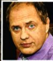
Uwe Ochsenknecht Schauspieler, Steinbock (7. 1. 1956): Komfort macht Erdzeichen-Geborene glücklicher als Quadratmeter – gemäß der Devise: klein, aber mein