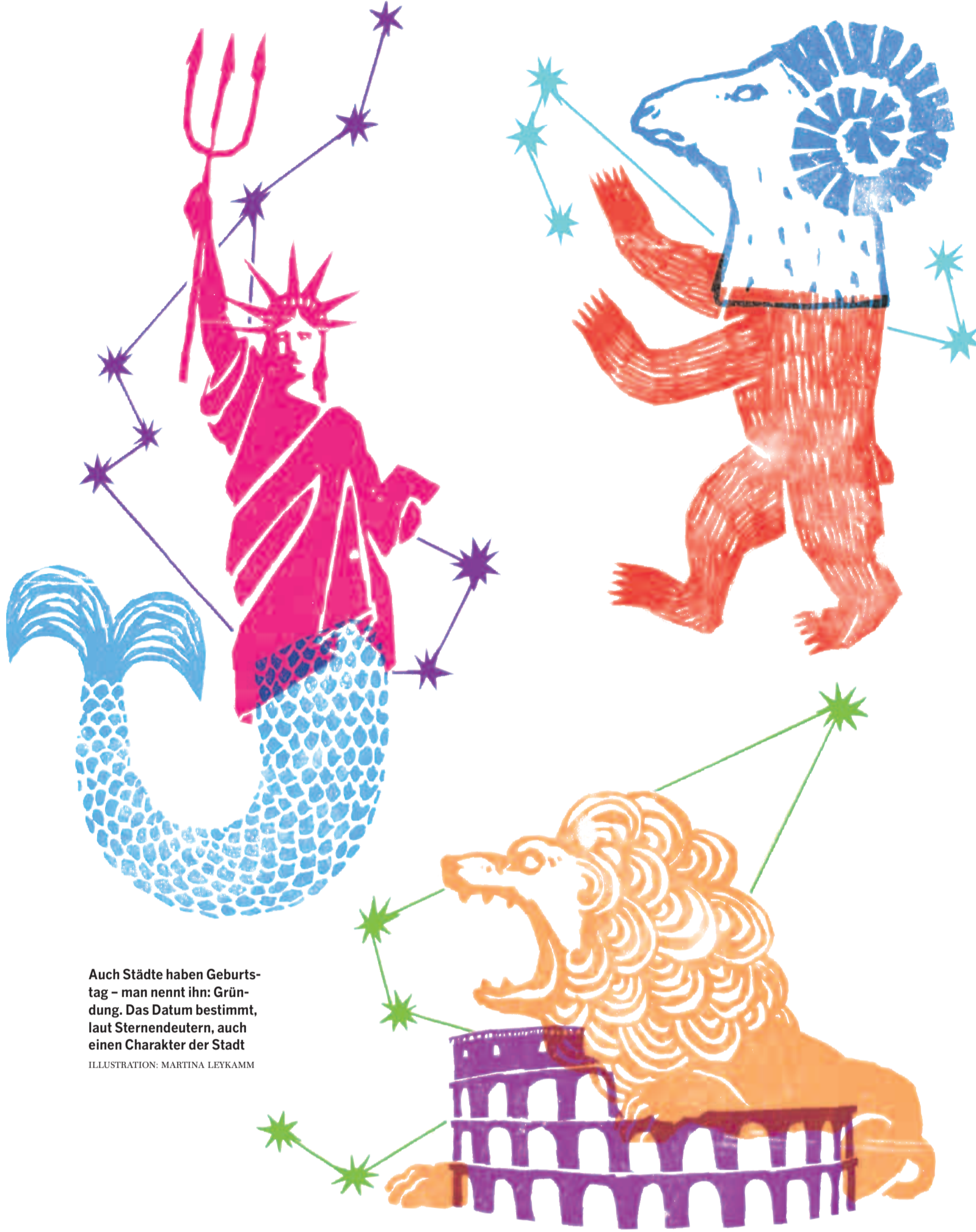
Auch Städte haben Geburts-tag – man nennt ihn: Gründung. Das Datum bestimmt, laut Sternendeutern, auch einen Charakter der Stadt

New York: eine Wassermann-Stadt, geprägt von Uranus, dem Gott des Himmels. Der Wassermann will Freiheit und Gleichheit, er hat nichts gegen Überraschungen. Wo Stier oder Waage schnell unsicher werden, fühlt sich ein Wassermann erst wohl.