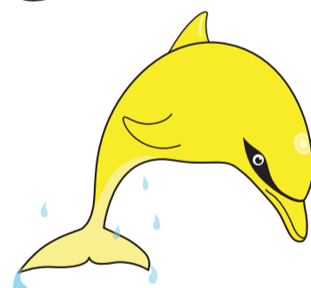
ist der springende Delfin.“

Die Meeressäuger, so lernt man bei „Flipper“, in der Delfinschau und in zahlreichen Delfinbüchern und Delfinfilmen, sind klug, friedlich und stets hilfsbereit. Sogar ein Katholikentag schmückte sich einmal mit einem Delfin-Logo. Der damalige Vorsitzende der Deutschen Bischofskonferenz, Kardinal Karl Lehmann, begründete dies so: „Wir brauchen ein kräftiges Symbol, das uns die Hoffnungskraft des christlichen Glaubens mit allem Schwung und in voller Reichweite konkret vor Augen stellt. Das Symbol für diese Kraft der Hoffnung