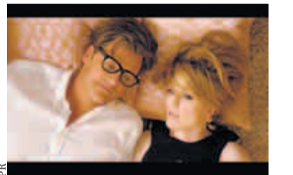
„A Single Man“ von Tom Ford: Die Menschen stören ein bisschen

Der größte kulturelle Schock bei meinem Umzug nach New York, schlimmer als Sicherheitstick und der leichtfertige Umgang mit verschreibungspflichtigen Drogen, war die Angewohnheit der Bewohner, wesentliche Teile ihres Wochenendes beim Brunch zu verschleudern. Daran ist eigentlich alles schlecht: Brunch hat weder die zielgerichtete Präzision eines Frühstücks noch die immanente Dekadenz eines guten Mittagessens. Man hängt irgendwie zwischen den Stilen, muss bei Tageslicht bereits Alkohol trinken und vor allem: Man isst viel zu viel Ei.