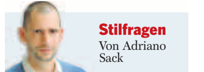
Stilfragen Von Adriano Sack

Jedem Teilnehmer steht eine Stunde zu. Die Stunde der Wahrheit. Der Wassermann erfährt, dass der Schütze ideal als Partner ist, denn der eine ist ein Luft-, der andere ein Feuerzeichen, das ergänzt sich. Stier und Widder sind ein optimales Duo, der eine baut ein Nest, der andere verteidigt es. Die Kombi Zwilling und Steinbock kann gehen, sind beide flexibel. Paaren sich Krebs und Löwe, funktioniert das meistens. Die Jungfrau passt, wenn überhaupt zu jemand, dann zum Fisch, die Waage zum Skorpion. Aber am Ende kann vieles gehen, wird alles im Horoskop richtig gedeutet. Aufbruchstimmung am Abreisetag, fröhliche Gesichter. Im Glauben an das Überirdische lebt es sich nicht nur, sondern liebt es sich auch besser.